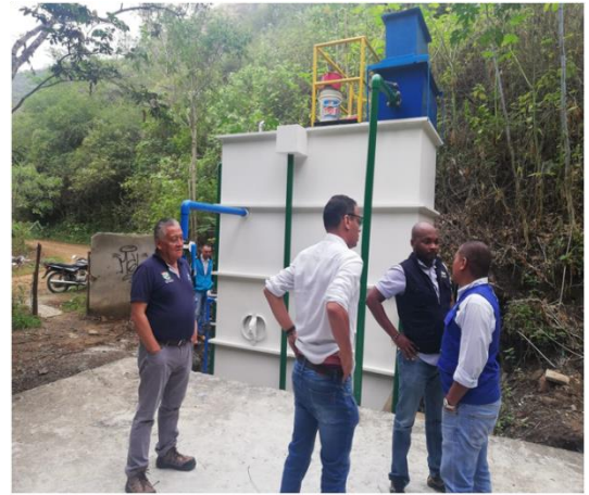
OPTIMIZACIÓN COMPLETA DEL SISTEMA DE ACUEDUCTO DE LA VEREDA DE PAJARO DE ORO UBICADO EN EL MUNICIPIO DE LA UNIÓN