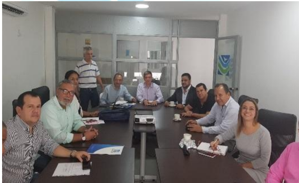
Mecanismo Departamental de Evaluación y Priorización de Proyectos

En el 2019, se radicaron 28 proyectos, de los cuales se han viabilizado 8 por un Valor de $18.827'873.663