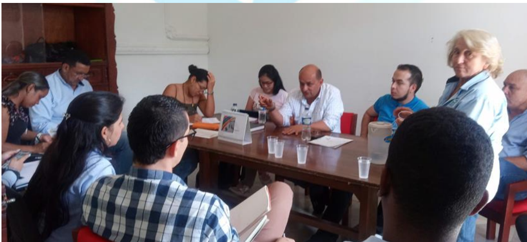
Reunión con comités coordinador PGIRS de los municipios de Candelaria, Dagua, Ginebra y Guacarí

El ajuste se realizó a lo dispuesto en el Decreto 1077 de 2015 expedido por el Ministerio de Vivienda, Ciudad y Territorio (que contiene el Decreto 2981 de 2013) y a la metodología aplicada en la Resolución 0754 de 2014. Aquellos Municipios clasificados en las categorías quinta y sexta, según el artículo 6 de la Ley 1551 de 2012 o la norma que lo modifique o sustituya, no están obligados a desarrollar dentro del PGIRS el árbol de problemas y el árbol de objetivos.