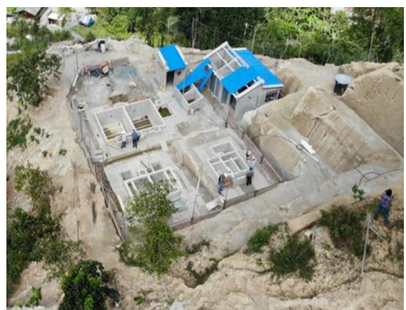
CONSTRUCCIÓN DEL SISTEMA DE ACUEDUCTO DEL CORREGIMIENTO DE ALASKA, MUNICIPIO DE BUGA