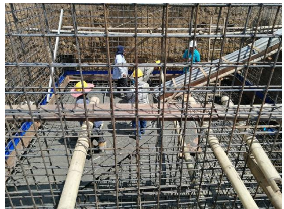
CONSTRUCCIÓN DEL SISTEMA DE ACUEDUCTO DEL CORREGIMIENTO DE ZANJÓN HONDO - MUNICIPIO DE GUADALAJARA DE BUGA