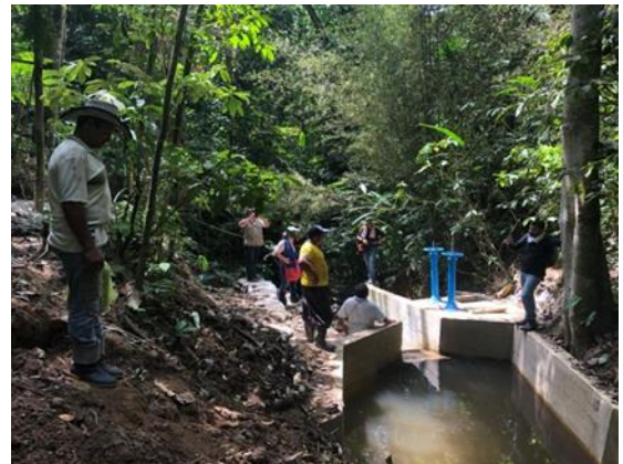
CONSTRUCCIÓN PARA LA OPTIMIZACIÓN DEL SISTEMA DE ACUEDUCTO Y PTAP INTERVEREDAL DE SAN ISIDRO – EL CHUZO DEL MUNICIPIO DE OBANDO